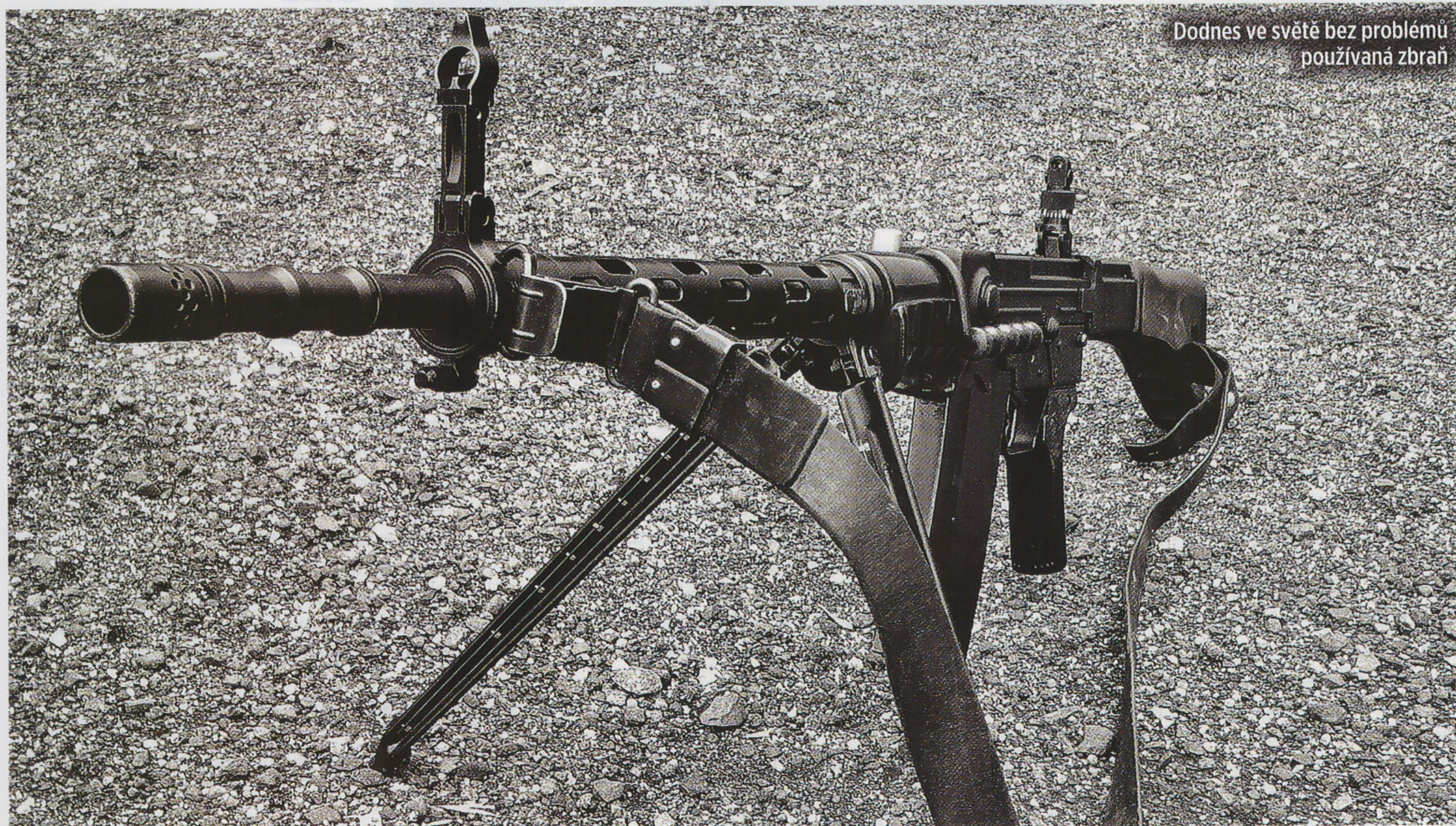
Dodnes ve světě bez problémů používaná zbraň

Další odvozenou variantou od původní pušky SG 510 byla SIG SG 510-4 menších rozměrů a pro náboj 7,62x51 mm, standardní střelivo NATO, díky čemuž expandovala do Jižní Ameri-