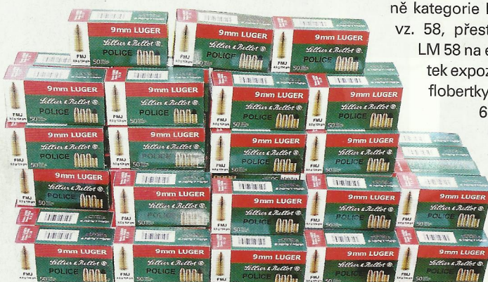
Velká cena Střelecké revue se tradičně koná s podporou firmy Sellier & Bellot

Střelecký klub ve Zruči nad Sázavou vytvořil pro závod tradičně příjemné prostředí, ke kterému patří i dostatek jídla a vzhledem k vedru také pití.