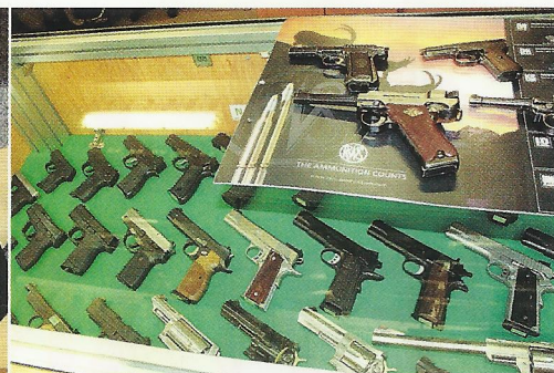
V nabídce samozřejmě nechybějí ani krátké palné zbraně. Prodejna se nespécializuje na konkrétní značku, ale nabízí jich široké spektrum.

Návštěvnost prodejny je díky výběru sortimentu dost dobrá, skladem tu drží asi 150 typů