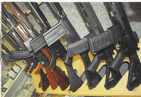
Výběr zbraní od moderních po starší je dostatečně pestrý, aby si zde každý zákazník našel, co potřebuje – pro vlastní ochranu i na sport a zábavu.

„Je sice hezké, že jim zvládnou vybrat kvalitní zbraň, namontovat na ni optiku a donést jim ji s krásnou nástřelkou. Ale lovit nechodím a v tu chvíli k nim mám opravdu hrozně daleko. Myslím, že myslivci hodně dají na to, když je prodejce zároveň jedním z nich. A já mám zvrátka rád a střelbu do nich neumím. A tak i když