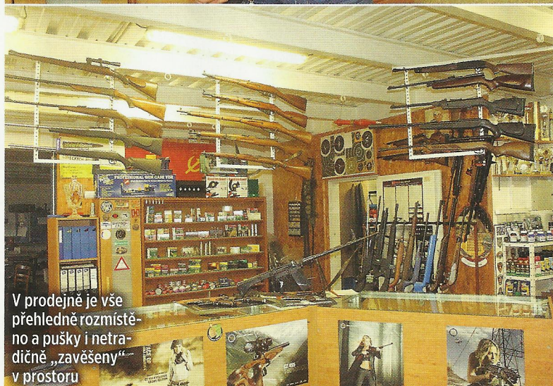
V prodejně je vše přehledně rozmístěno a pušky i netradiční „zavěšeny“ v prostoru