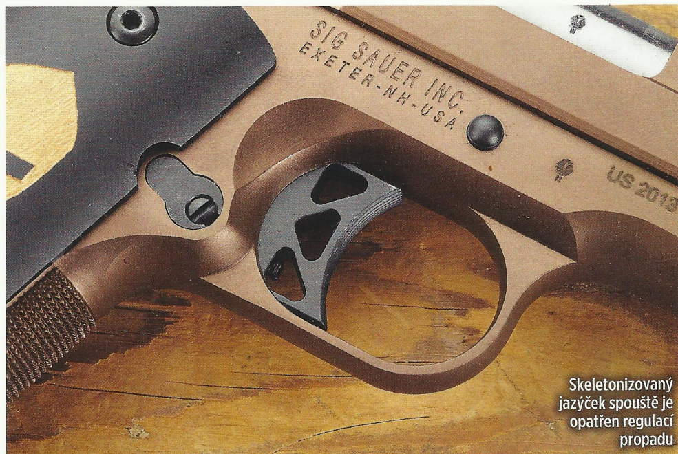
Skeletonizovaný jazýček spouště je opatřen regulací propadu

Typickým příkladem mohou být dnes již historické zbraně Colt Mustang nebo Pony. Také SIG SAUER modely pistolí v subkompaktní