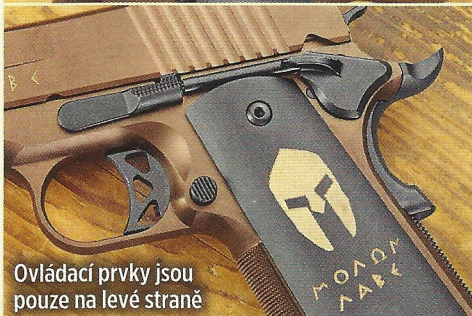
Ovládací prvky jsou pouze na levé straně