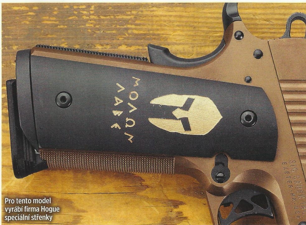
Pro tento model vyrábí firma Hogue speciální střenky