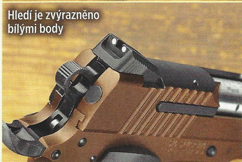
Hledí je zvýrazněno bílými body